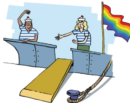
Thema 'gelijke kansen binnen een inclusievere leeromgeving'