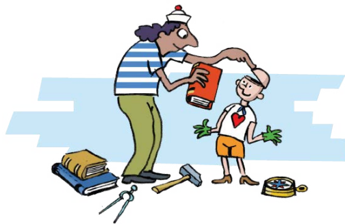
Thema 'kennis en vaardigheden van leerlingen'

Met de zes thema's uit deze Kennisagenda kun je immers het verschil maken. Door drie thema's te kiezen voor Onderwijsgroep Amstelland is focus aangebracht en heeft besluitvorming plaatsgevonden op de thema's die het meest belangrijk zijn voor de Onderwijsgroep op dit moment en in de toekomst.