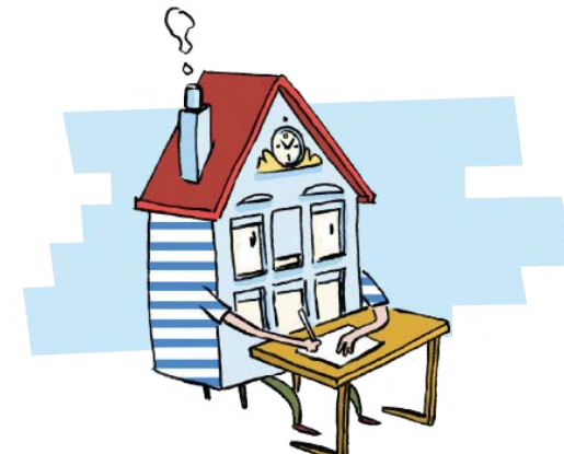
Thema 'Een lerende en professionele organisatie'